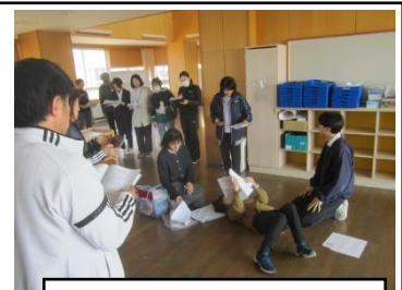
緊急時の対応研修

この春、多くの異動がありました。新しいメンバーとなった教職員が一日も早く燕南小児童について理解を深めたり、環境に慣れたりするために始業式の前から職員研修を実施しています。まず行ったのは食物アレルギー等に係る研修です。どの教職員も「そのとき」に直面した際、落ち着いて迅速、適切に対応することが求められます。今後も児童理解、授業力向上、いじめ等の未然防止・即時対応にかかわる研修などを計画的に実施していきます。