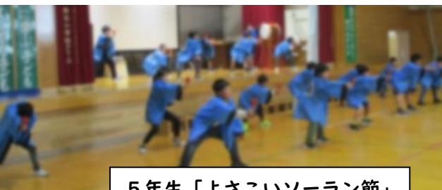
5年生「よさこいソーラン節」