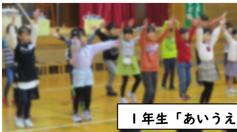
1年生「あいうえおんがく」「きらきらぼし」