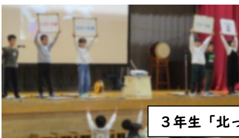
3年生「北っ子かるた探検隊」