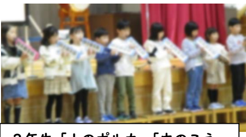
2年生「山のポルカ」「虫のこえ」