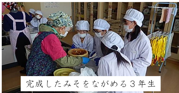
完成したみそをながめる3年生

3年生は、昨年みその仕込みをして、今年6月に天地返しをしました。12月4日(木)は、その味噌樽を開けました。みそが完成したお祝いにお世話になった皆さんにみそおにぎりをふるまいました。