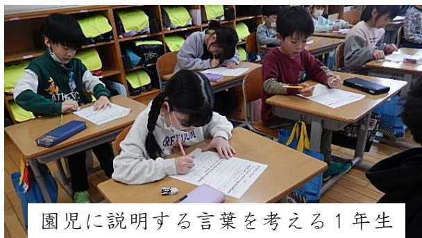
園児に説明する言葉を考える1年生

1年生は、弥彦公園で見つけた宝物を使っておもちゃランドを作りました。12月15日(月)によした保育園年長組の園児さんを招いて、おもちゃランドを開きます。お客さんを楽しませるよう準備しています。