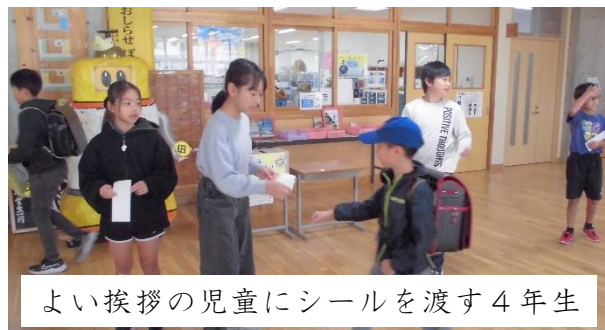
よい挨拶の児童にシールを渡す4年生

11月に入り、4年生は、吉田小にスマイルの輪を広げるために、朝のあいさつ運動、ゲーム大会、草むしり、劇や特技の披露などを行っています。多くの児童が活動に興味をもって参加しています。