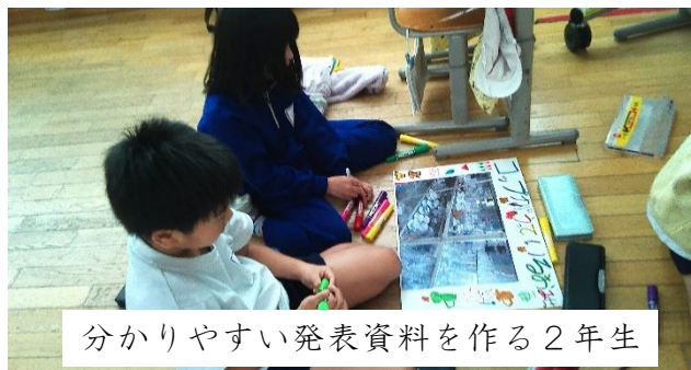
分かりやすい発表資料を作る2年生

2年生は、生活科の学習で町探検をしました。12月17日(水)に探検で見つけたことを保護者の皆さんに発表します。クイズを発表する班、写真を示して説明する班、児童は様々な工夫をしています。