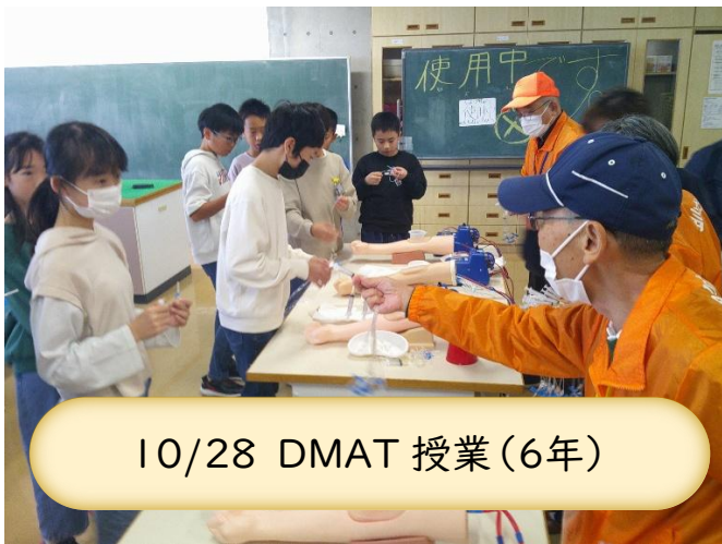
10/28 DMAT 授業(6年)