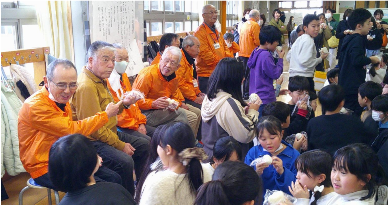
5年生「お米収穫祭」の様子（令和7年12月5日）

たくさんのボランティアの皆様のご支援により、子どもたちは、今年度も安全に、そして充実した活動や学習をすることができました。心より深く感謝申し上げます。