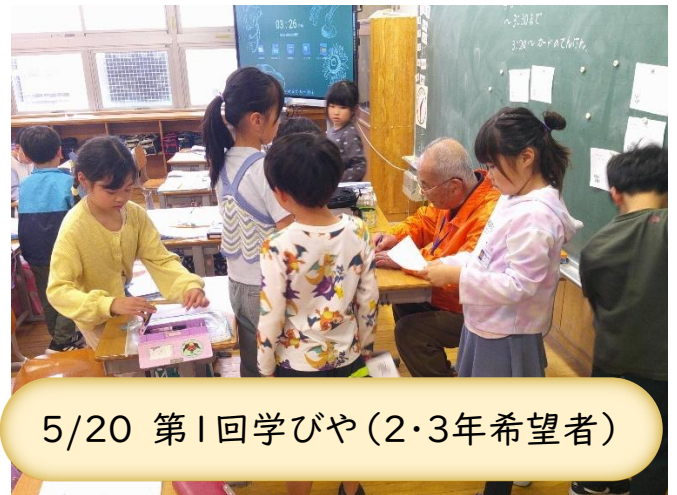
5/20 第1回学びや(2・3年希望者)