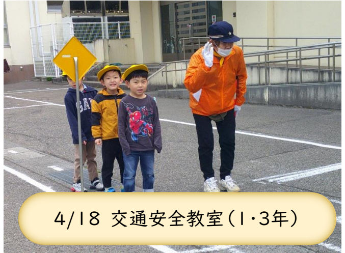
4/18 交通安全教室(1・3年)