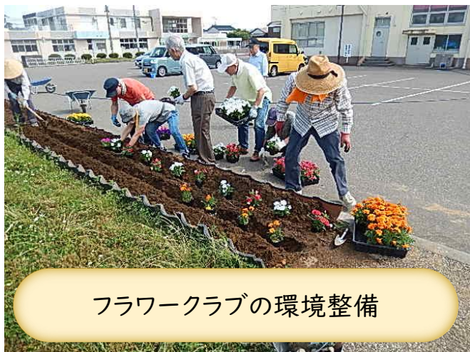
フラワークラブの環境整備