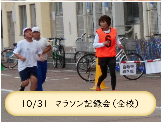
10/31 マラソン記録会(全校)