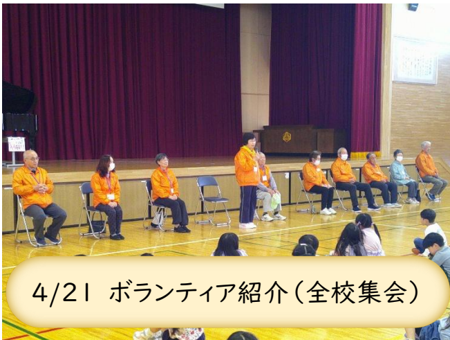
4/21 ボランティア紹介(全校集会)