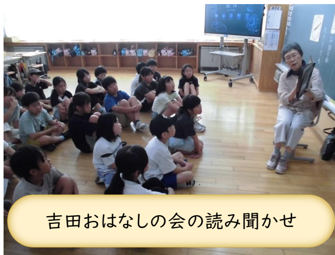
吉田おはなしの会の読み聞かせ