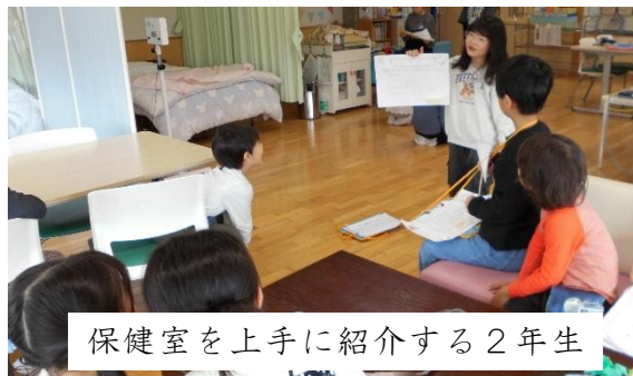
保健室を上手に紹介する2年生

4月23日(木)、2年生は1年生に校舎の案内をしました。相手に分かりやすい話し方を学ぶ活動をしています。2年生は「ここは校長室です。校長先生が仕事をする部屋です」と上手に説明していました。