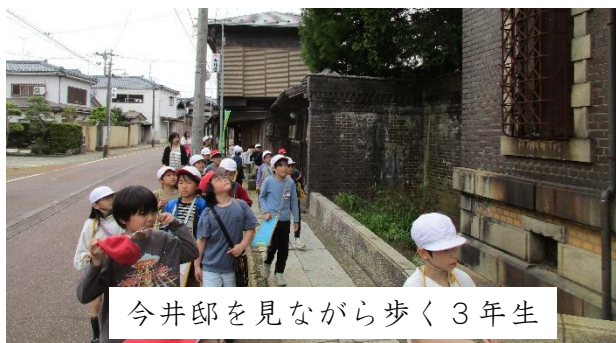
今井郎を見ながら歩く3年生

4月22日(水)、30(木)、5月7日(木)、3年生は、社会科の学習で町探検に行ってきました。吉田地区の公共施設、商店、田などがどこにあるのか見学しました。学校で地図を作成し、町の様子をまとめました。