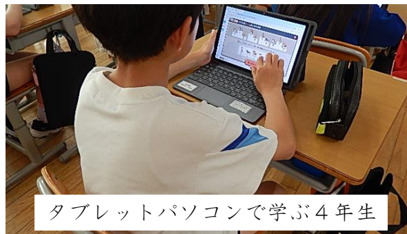
タブレットパソコンで学ぶ4年生

4月20日(月)、4年生は、算数の折れ線グラフの学習でパソコンを使ってグラフを表してみました。児童は、簡単に表現できるよさを実感していました。学習へのPC利用が多岐にわたって行われています。