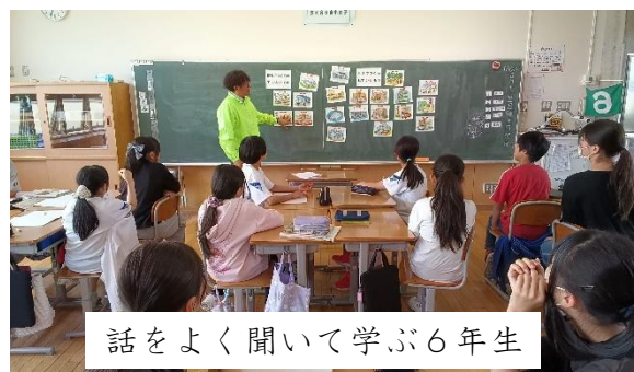
話をよく聞いて学ぶ6年生

5月11日(月)に、6年生は、社会科の学習で巻税務署の皆さんから税金の使い方を学びました。6年生は、「税金の使い道が分かった」「消費税は大事なんだね」と話していました。