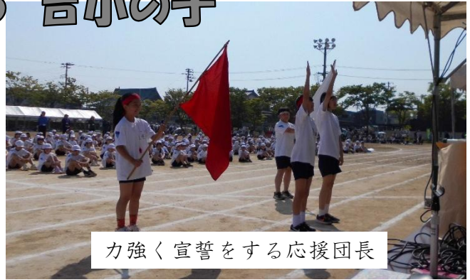
力強く宣誓をする応援団長

令和8年度大運動会を5月16日(土)に実施しました。児童は、赤白に分かれて、懸命に競技し、仲間を応援していました。結果は、競技、応援の部とも赤組が勝利しましたが、白組応援団長は、赤組の勝利を讃え、赤組応援団長も白組の健闘を讃える姿が見られました。まさに、歴史をかえる素敵な運動会となりました。