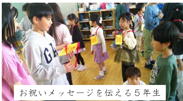
お祝いメッセージを伝える5年生

4月24日(金)、5年生は、1年生に入学をお祝いするペンダントをプレゼントしました。5年生は上学年となり、挨拶を進んでしたり、全校のための仕事をしたりがんばっています。