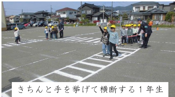
きちんと手を挙げて横断する1年生

4月17日(金)、1年生は、燕警察署、燕市交通安全協会、燕市役所、ボランティアの皆さんから安全な歩き方を学びました。1年生はお話をしっかり聞いて、実践し、「よくできたね」と褒められていました。