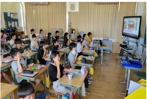
5年生 「全国歯磨き大会」