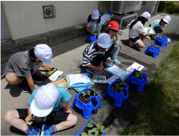
1年生 「アサガオの観察」