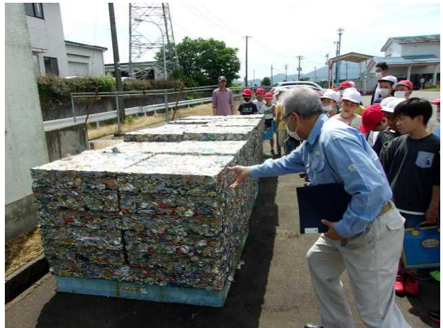
4年生 「環境センター社会科見学」