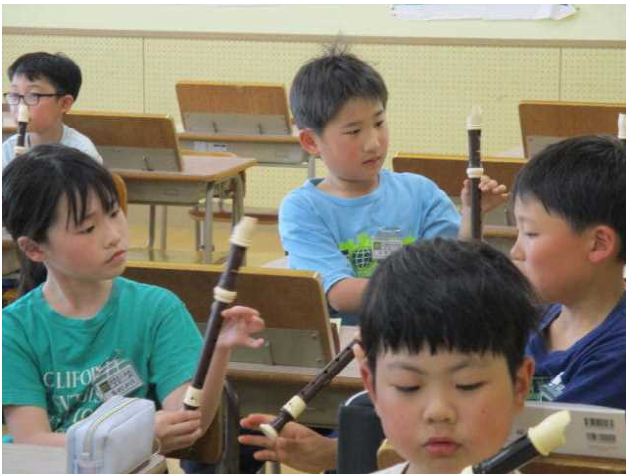
3年生 「リコーダー講習会」