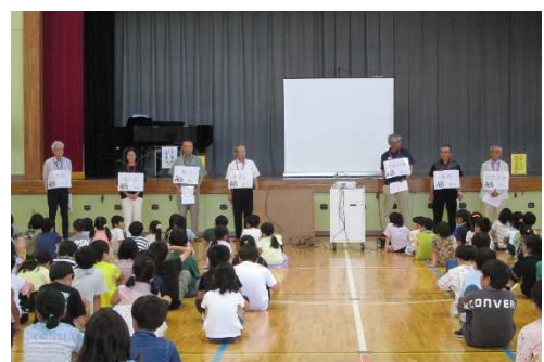
【子どもたちに自己紹介をしてくださった