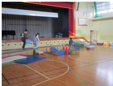
6年生 IT・恐怖のホラーゲーム