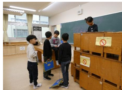
4年生 3番出口・としでんせつ