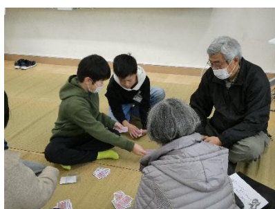
5年生 ピンポンカップイン・プレインロッドを 探せ・キーワードを探せ・休憩所